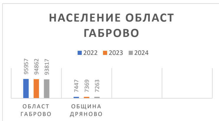
Фигура 1. Динамика на населението на ниво област Габрово и община Дряново, за периода 2022 – 2024г. 2

През периода 2022г. – 2024г. се запазва тенденцията за намаляване на населението, както на ниво област, така и на ниво община. Към 31.12.2024г., населението в община Дряново е 7 263 жители. В сравнение с 2023г. то е намаляло с 11,36%, което е повече с 3% в сравнение с